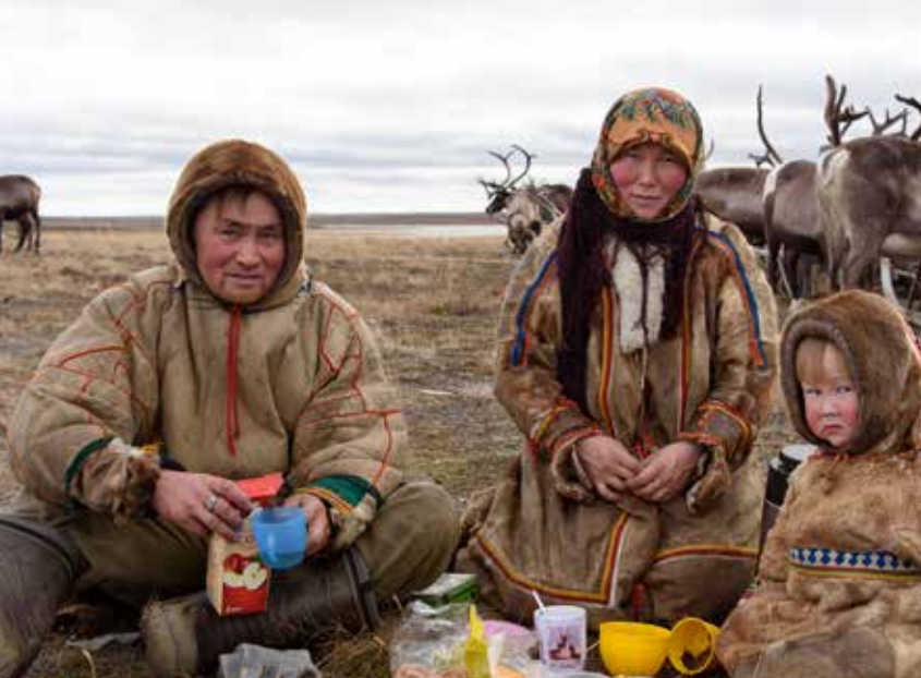
Familien i tredje brigade som jeg boede hos. En hyggestund med te og kiks inden karavanen sætter i gang og flytter mod næste lejr.